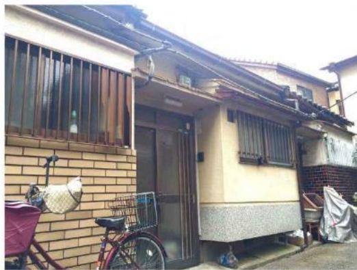
※略図につき現状優先とします！！